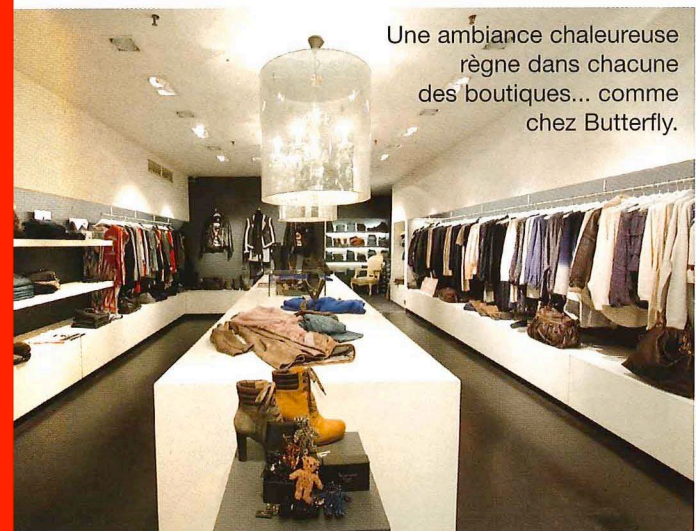
Une ambiance chaleureuse règne dans chacune des boutiques... comme chez Butterfly.

Ce tandem n'a de cesse de dénicher nos coups de cœur de demain. Rencontré il y a quatre ans lors d'un défilé, il n'a pas seulement mis en commun ses passions mais aussi... ses magasins.